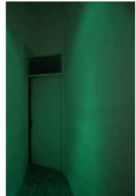
· 圖/藝術家及澳門藝術博物館

《唔該借歪》是這次展覽中唯一一件沒有陶瓷的作品，卻非常能代表慧德的創作。「唔該借歪」是「麻煩讓一讓」的意思，慧德在洗手間用燈光和聲音裝置，重現了她從外祖母那裡聽來的迷信習俗——去公共洗手間前與藏身其中的鬼打聲招呼。澳門的佈置團隊中有一位佈展人員，一開始對這作品很不以為然：「所以這個作品就是用來嚇人的？」他覺得外國人根本不能理解。但難道不能讓外國觀眾來學一句廣東話，也學習背後的地方習俗和民間智慧嗎？我焦急地想跟他解釋，卻說不上話來，這一直讓我格外地在意。沒想到的是，相處工作了一兩天後，我們和佈展團隊熟絡了許多，這位前輩也明白了作品的意圖，還專門為我們調整了燈光和佈置來達到最好的效果，讓我無比地感動。