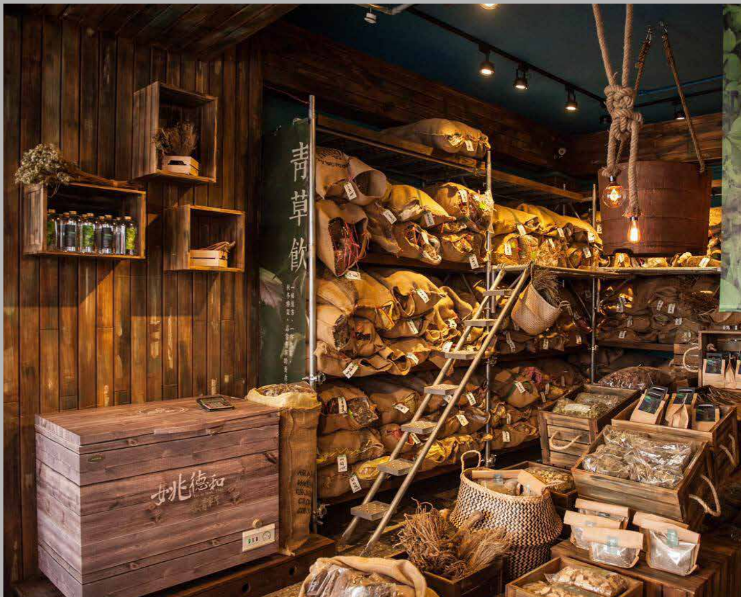
• 店裡裝修風格仍然保留着懷舊的精神與文化