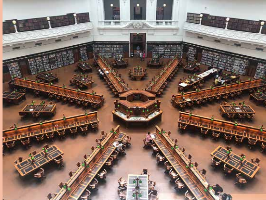
· 維多利亞州立圖書館

文學是人學，在墨爾本，文學就是生活哲學。墨爾本偽文青周日的正確打開方式是這樣的：周末睡到自然醒，約三五知己吃個高顏值的早午餐，穿過古靈精怪的小巷喝一杯Long Black或Flat White，下午帶着小狗跑步，在皇家植物園懶洋洋地野餐，或是到NGV美術館逛大展，晚上吃一頓佳餚，看一場戶外電影，喝一杯產自Yarra Valley的黑皮諾或霞多麗。阮囊羞澀的真文青，則流連在墨爾本市中心、世界十大著名圖書館之一的維多利亞州立圖書館，靜靜翻書、看免費展覽（我到訪那天正好是書籍裝幀和澳洲圖像詩運動展覽）。如此高大上的圖書館想必讓人正襟危坐了吧？就是坐在那美輪美奐的八角形閱覽區下西洋棋也無任歡迎。