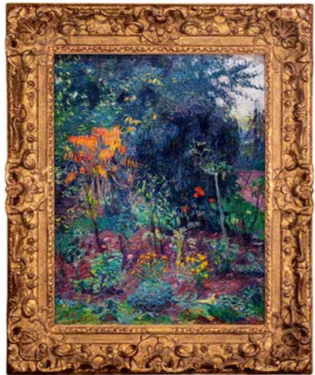
• 保羅·高更《花園一角》