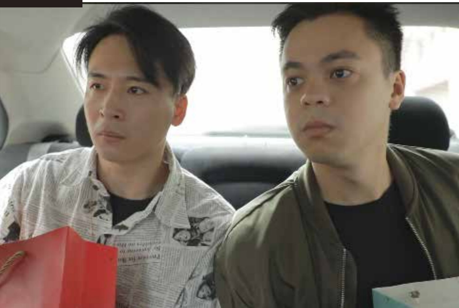
• 「老表抽水」系列，諷刺時弊、內容貼地，在網絡上大受歡迎。