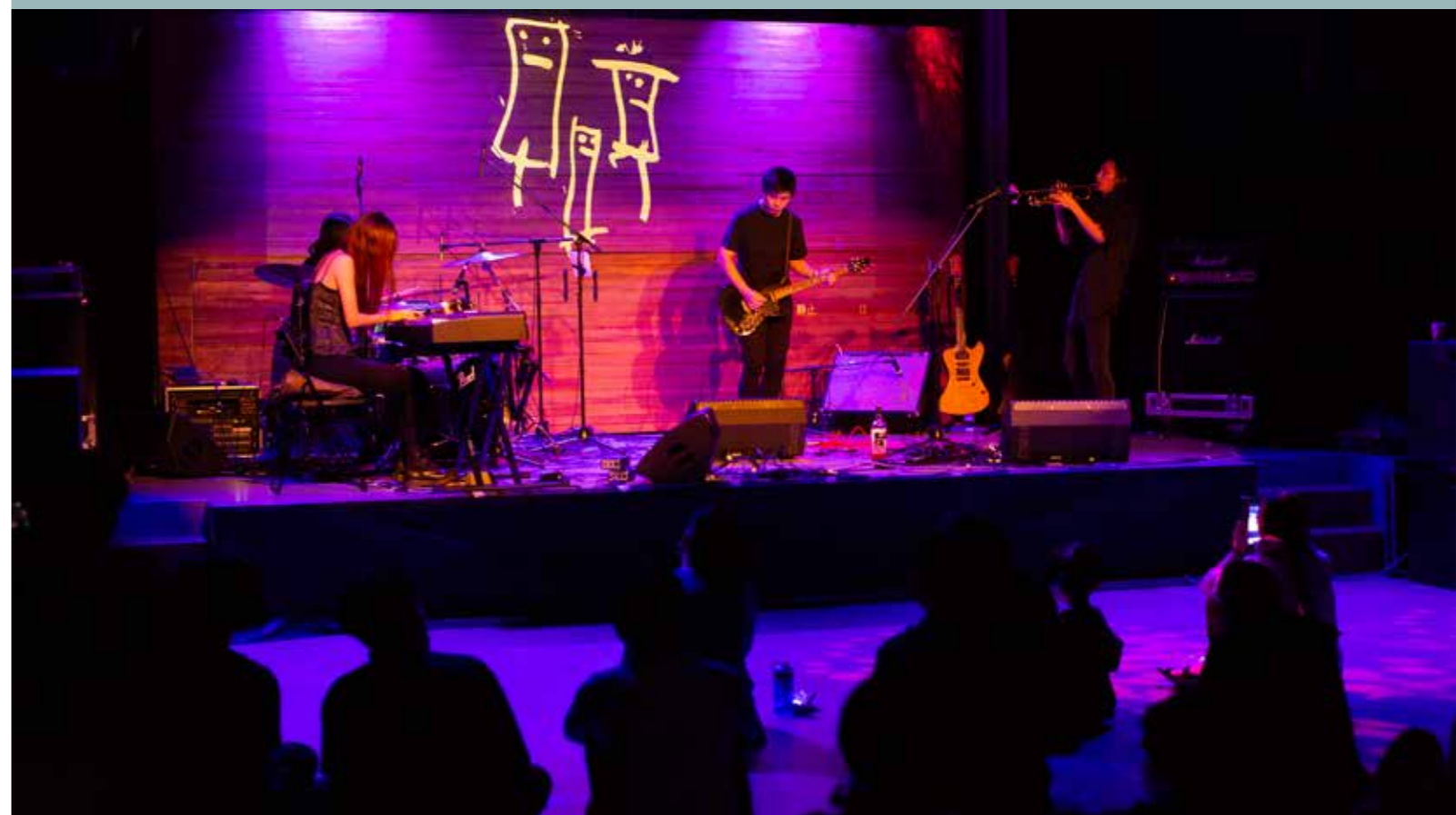
• 今年6月，Forget the G聯同廠牌旗下藝人在海事工房2號舉辦搖滾音樂節。

只要在澳門生活一段日子，或多或少都會有機會欣賞到一兩場世界級的演出，這跟澳門作為世界旅遊休閒中心的定位相當符合，但是當人們將焦點放在這些世界一流的同時，對於澳門本土的音樂團體大家又認識多少呢？Forget the G樂隊，是文化局首屆「原創歌曲專輯製作補助計劃」的獲補助者之一，至今已成軍將近15年，運用打破常規的創作方式去打動聽眾，暗黑詭異的風格為樂隊塑造出獨一無二的音樂標籤！