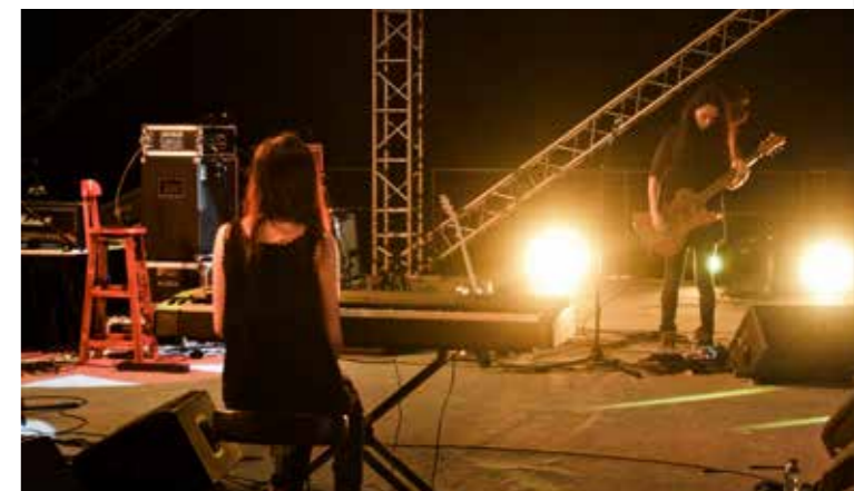
• 樂隊在不同地區舉辦巡演，爭取曝光。