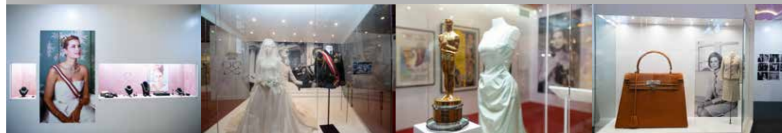
• 展覽展出多件珍藏於摩納哥王宮的嘉麗絲王妃專有之藝術臻品

呂嘉瑩認為「藝文薈澳」活動為澳門引入來自世界各地的國際級藝術展覽，能夠深化澳門長久以來作為中西文化藝術交流平台的角色，「『銀娛』感到十分榮幸，能夠透過這次的國際性展覽，從中協助提升澳門的文化旅遊魅力，助力澳門打造為世界級文化藝術交流平台。未來，『銀娛』將一如既往探索和引入不同種類的文化、藝術產品，為本澳市民和旅客創造更多世界級的休閒度假體驗，與澳門社區共同為『世界旅遊休閒中心』的建設作出貢獻。」