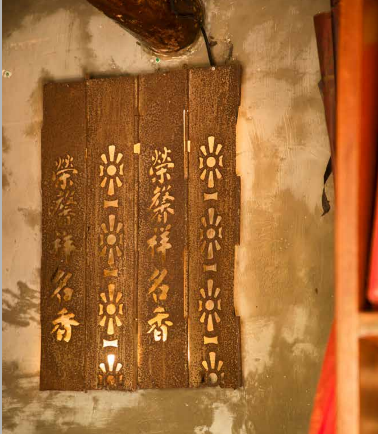
• 店內保留不少具歷史感的元素，突顯老店特色。