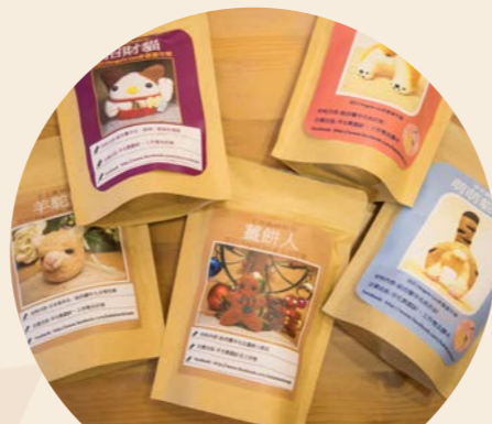
羊毛氈材料包 售價：MOP40起