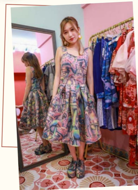
童夢時代系列連身裙 售價：MOP799