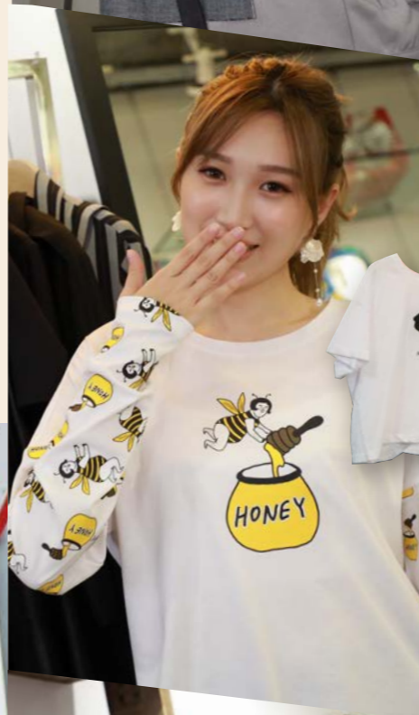
親子香味睡衣套裝 (蜜糖、香桃、牛奶三種香味) 品牌：MACON 售價：成人套裝 MOP328； 小童套裝 MOP268； 親子套裝 MOP450-MOP500