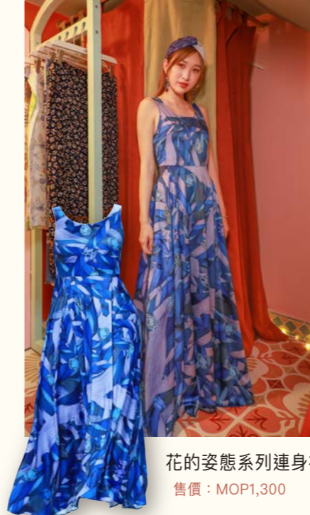
花的姿態系列連身裙 (藍色) 售價：MOP1,300