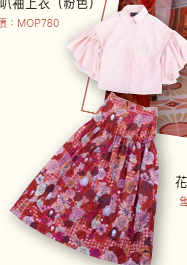
花的姿態系列長裙 (紅色) 售價：MOP1,000