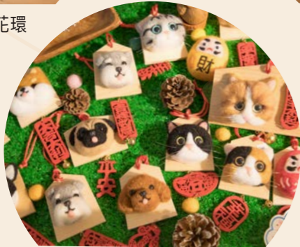
貓狗頭祝賀繪馬牌 售價：MOP180起