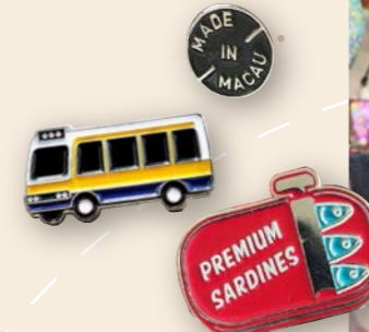
澳門特色襟章 品牌：Loving Macau 售價：MOP40