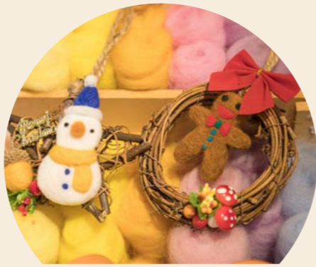
聖誕滕圈掛飾 售價：MOP120