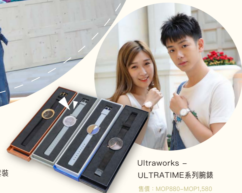
Ultraworks – ULTRATIME系列腕錶 售價：MOP880-MOP1,580