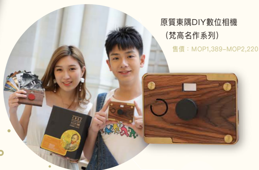
原質東隅DIY數位相機 (梵高名作系列) 售價：MOP1,389-MOP2,220