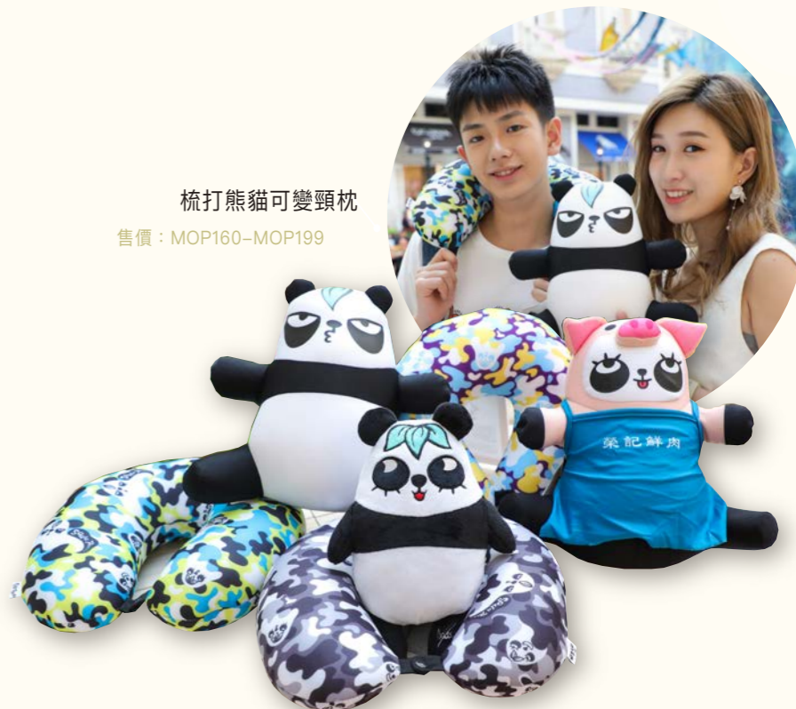
梳打熊貓可變頸枕 售價：MOP160-MOP199