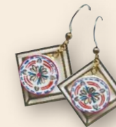
時尚耳環 品牌：ADD something on 售價：MOP120-MOP150