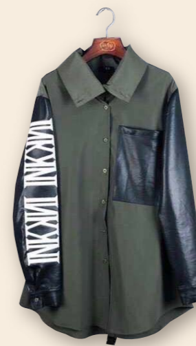
立領抽帶皮袖襯衫 品牌：I.N.K 售價：MOP890