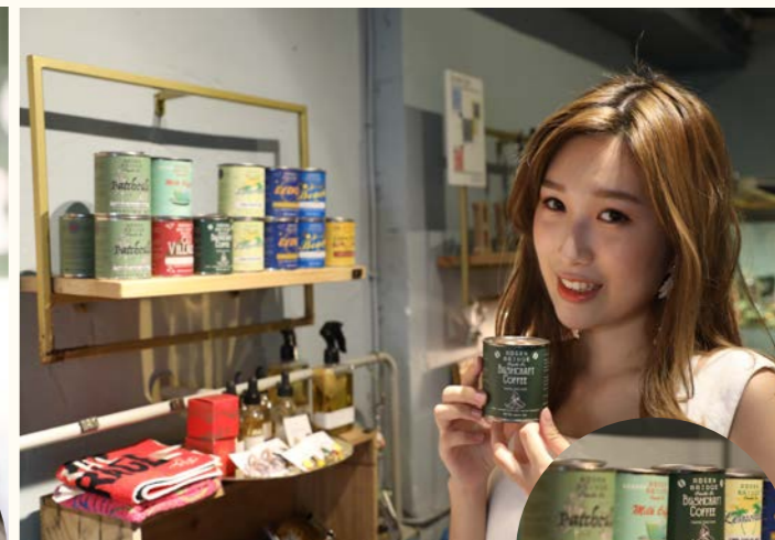
ROSEN BRIDGE 木心天然大豆蠟燭（香港） 售價：MOP200