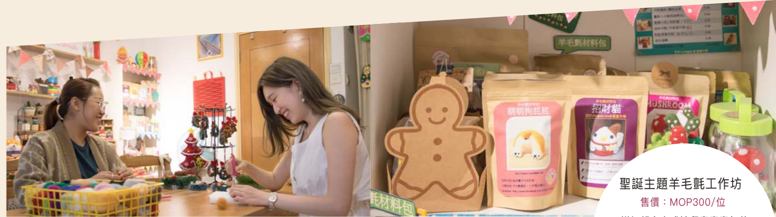
聖誕主題羊毛氈工作坊 售價：MOP300/位 *詳細報名方式請留意嘉嘉年華官方社交平台

嘉嘉年華在年底會推出一系列節日限定的羊毛氈手作品及工作坊，如薑餅人花環、聖誕滕圈掛飾、農曆新年貓狗頭祝賀繪馬牌等，有興趣的朋友可前來選購訂做羊毛氈製品或參與工作坊。