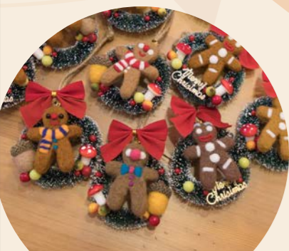
薑餅人迷你聖誕花環 售價：MOP120