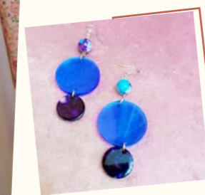
ella épeler耳環 售價：MOP120- MOP150