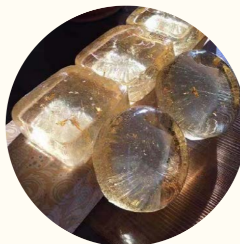
氨基酸金箔手工皂工作坊