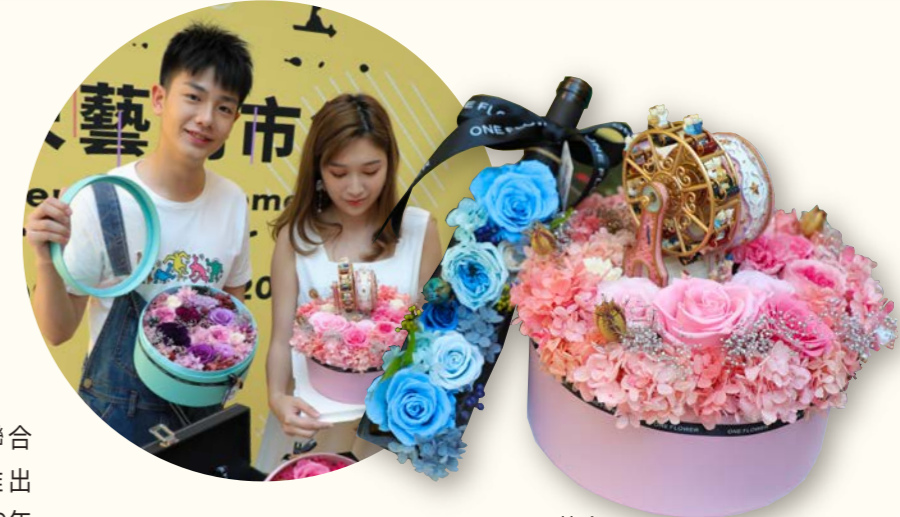
One Flower 保鮮花花盒 售價：MOP880-MOP1,280

對文創話題感興趣的朋友還可以報名參與MGM Art Camp X cMarket現場舉辦的文創交流活動，由澳門本地設計師及美高梅代表作經驗分享，讓你體驗不一樣的假日文創休閒活動！