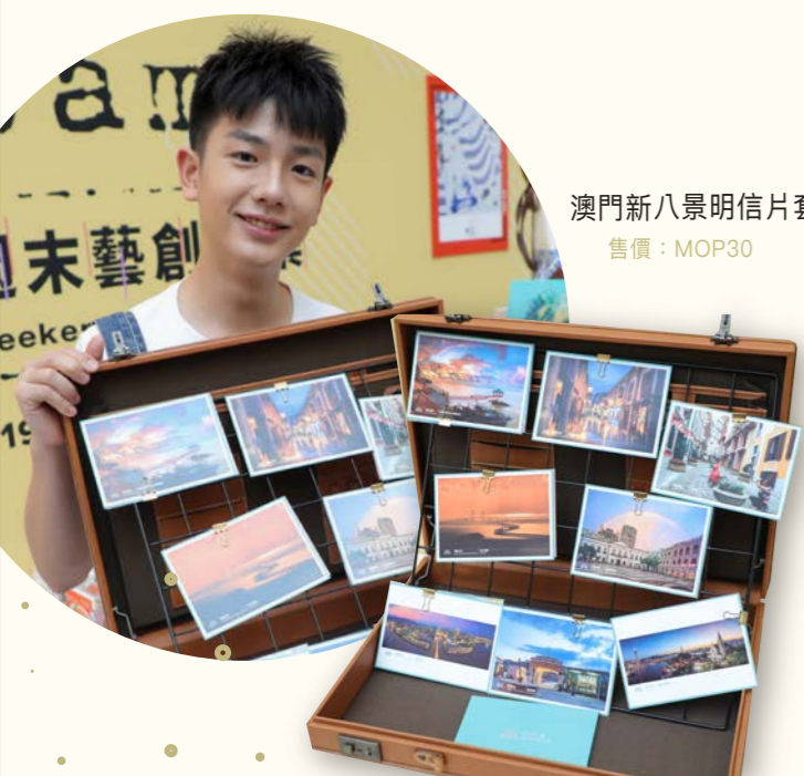
澳門新八景明信片套裝 售價：MOP30