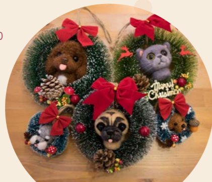
貓狗聖誕花環 售價：MOP180起