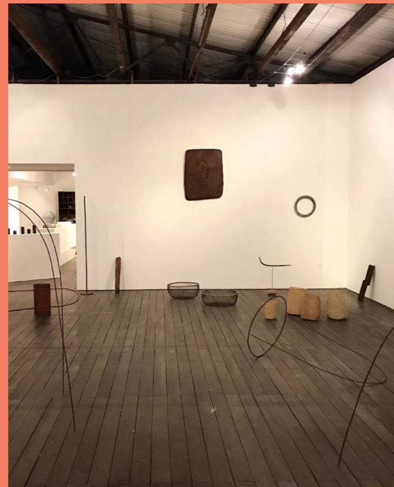
• Gallery Yamahon內的作品展

工藝藝廊除了販賣之外，其中更重要的任務，是培育年輕一代的創作者與受眾、梳理出時代當中的美學脈絡，甚至將之烙在歷史當中。這也是丈夫比起收入，更重視與藝廊的關係的原因。究竟我們有否這能耐，創立一家能實踐我們珍視的價值的藝廊，成為足以提攜後輩的前輩呢？我和丈夫都還在向自己探問。