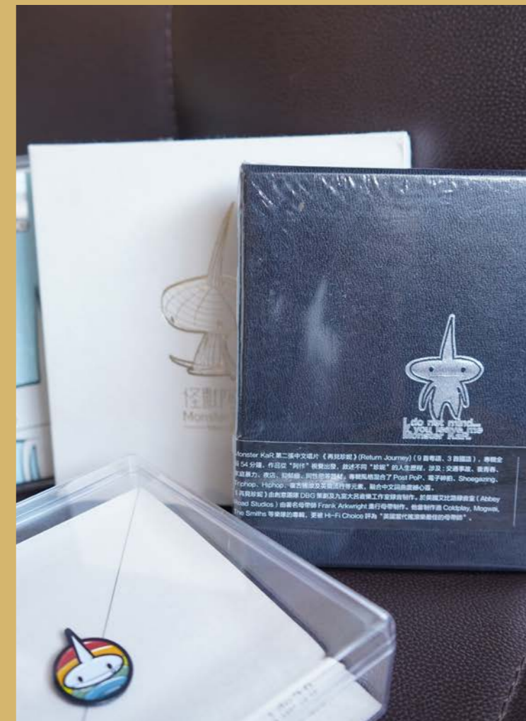
• 樂隊Monster KaR先後推出三張音樂專輯