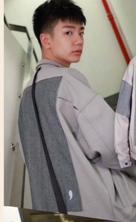
Panel denim jacket 品牌：Common comma 售價：MOP950