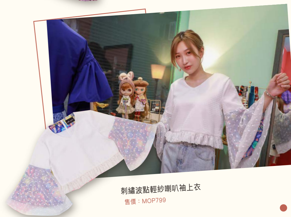
刺繡波點輕紗喇叭袖上衣 售價：MOP799